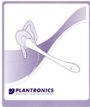
Гарнитуры для мобильной связи